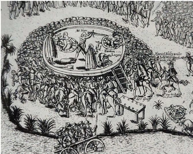
Darstellung der Hinrichtung der Entführer des Bäckers Philipp Ecks in Köln. Die beiden Täter wurden am 28. Oktober 1588 an der Richtstätte Rabenstein bei Melaten zunächst gerädert und dann enthauptet ("uff rader gesatzst, die köp abgehauen").