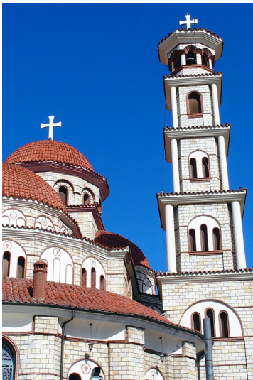
Auferstehungskathedrale in Korça