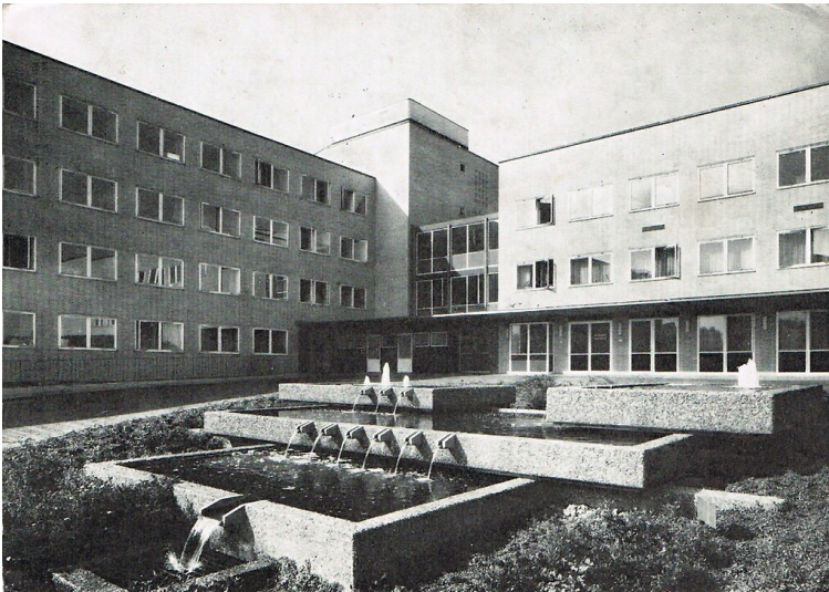
Die von dem Architekten Benno Schachner gestaltete Brunnenanlage vor dem Haupteingang des Kinderkrankenhauses in Köln-Riehl auf einer Ansichtskarte von 1968.