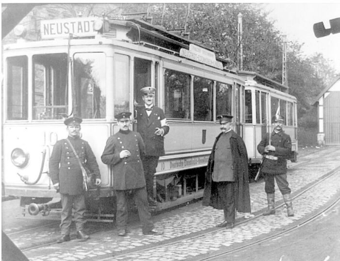
Ehemalige Pfälzische Oberlandbahn