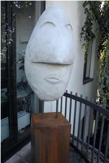
Skulptur „Der Skeptiker“ der Künstlerin Angelika Lesemann in Köln-Riehl (2022). Fotograf/Urheber: Angelika Lesemann