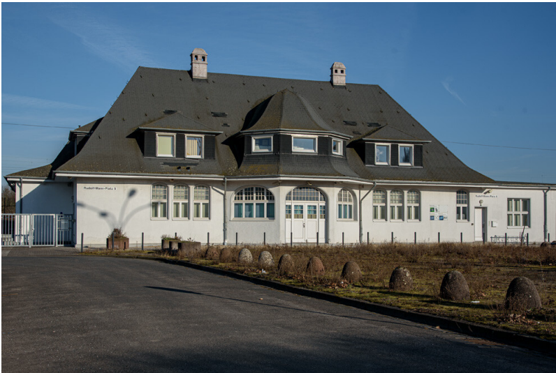
Bahnhof Wiesdorf Stadtseite (2021)