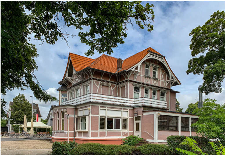
Direktorenvilla Carbonit Schlebusch (2021)