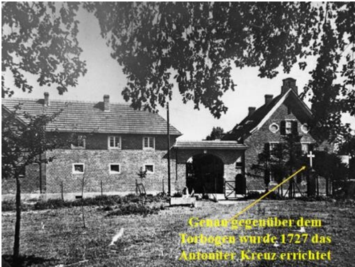
Antoniterkreuz am Rheinfelder Hof (nach 1727)