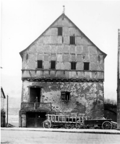
Historische Fotografie des Alten Rathauses an der Lahnstraße in Dausenau (1934)