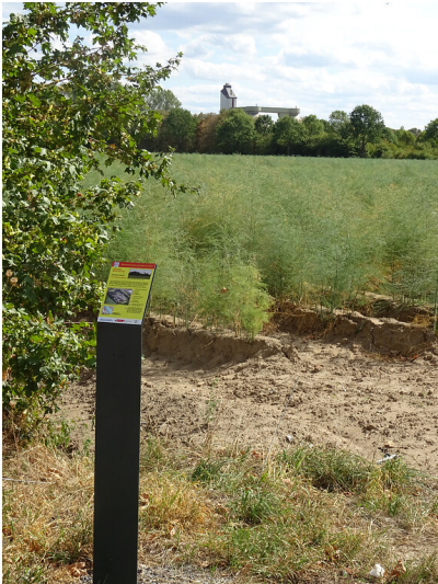
Abb. 1: Erzählstation "Klärwerk Köln-Langel" am Wassererlebnispfad von Pulheim zum Rhein (2018)