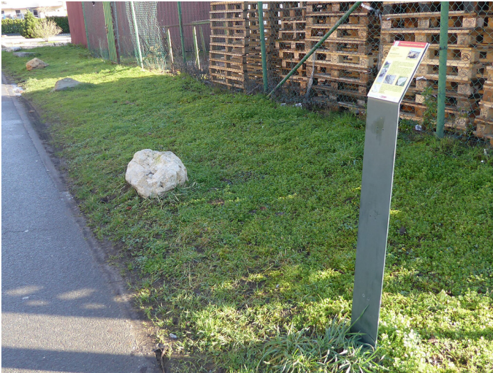
Abb. 1: Erzählstation "Driftblöcke" am Wassererlebnispfad von Pulheim zum Rhein (2021)