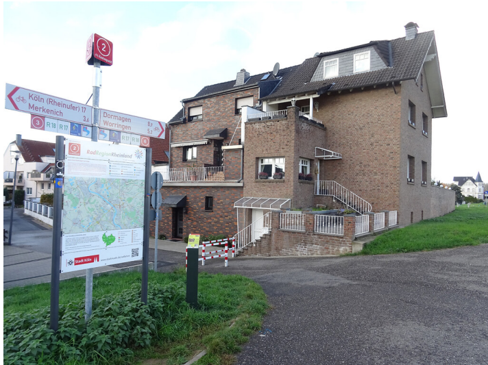
Abb. 1: Erzählstation "Altes Brauhaus Langel" am Wassererlebnispfad von Pulheim zum Rhein (2018)