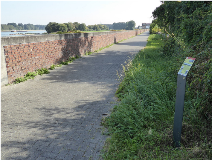
Abb. 1: Erzählstation "Hochwasserschutz" am Wassererlebnispfad von Pulheim zum Rhein (2021)