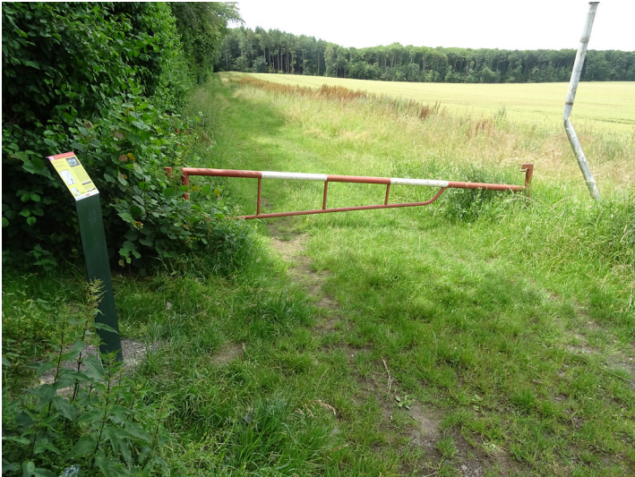
Abb. 1: Erzählstation „Grundwassermessung und Rheinarme“ am Wassererlebnispfad von Pulheim zum Rhein (2018)