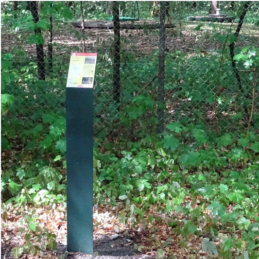
Abb. 1: Erzählstation "Brunnengalerie Weiler" am Wassererlebnispfad von Pulheim zum Rhein (2018)