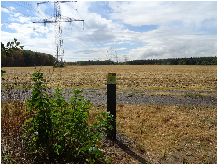
Abb. 1: Erzählstation Vorbeugender Gewässerschutz am Wassererlebnispfad von Pulheim zum Rhein (2018)