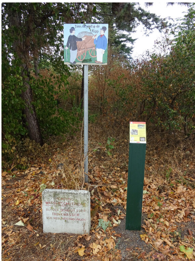
Abb. 1: Erzählstation Versickerungsanlage Esch des Wassererlebnispfades von Pulheim zum Rhein (2018)