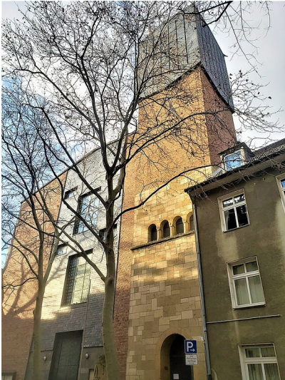
Fassade und Turm der 1947 bis 1954 erbauten katholischen Pfarrkirche St. Mechtern in Köln-Ehrenfeld (2020). Im Erdgeschoss ist der erhaltene Turm der neuromanischen Vorgänger-Kirche von 1907 einbezogen.