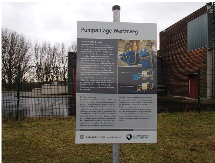
Abb. 1: Erzählstation Pumpanlage Werthweg am Wassererlebnispfad von Pulheim zum Rhein (2018)