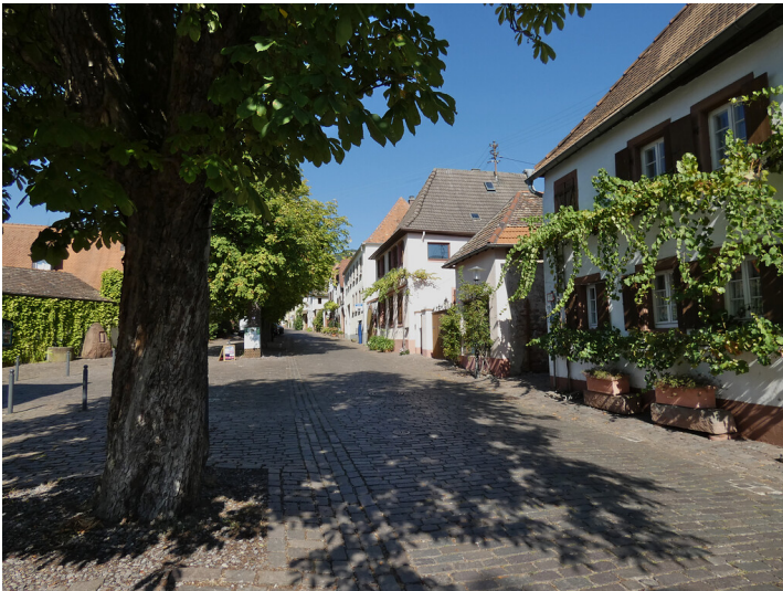
Theresienstraße in Rhodt unter Rietburg