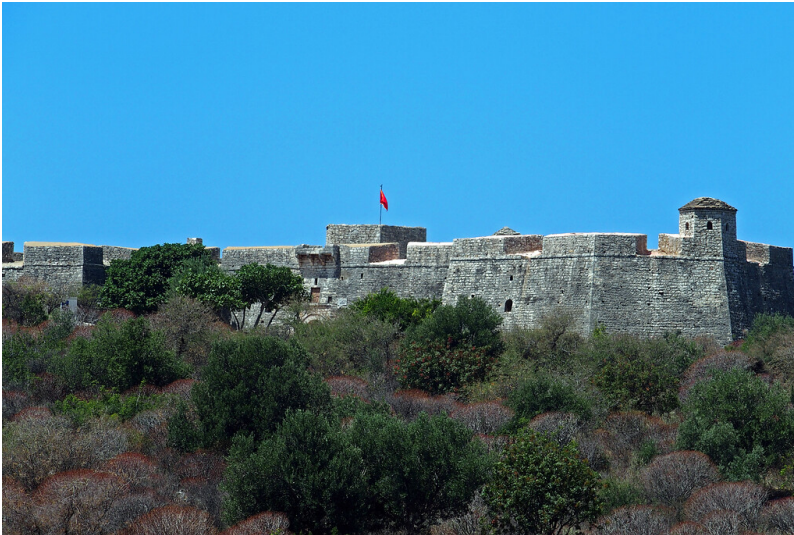
Ali Pascha Festung in Porto Palermo, Albanien (2022)