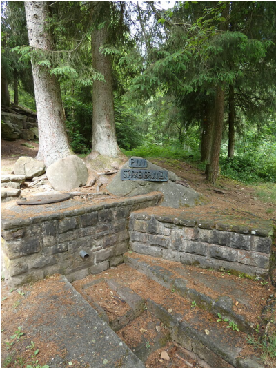
Ritterstein Nr. 223 "Starkenbrunnen" westlich von Ruppertsweiler (2022)