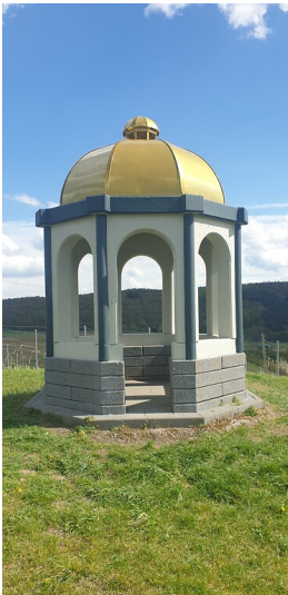
Die Dombergkuppel auf dem Domberg südlich von Waldlaubersheim (2021)