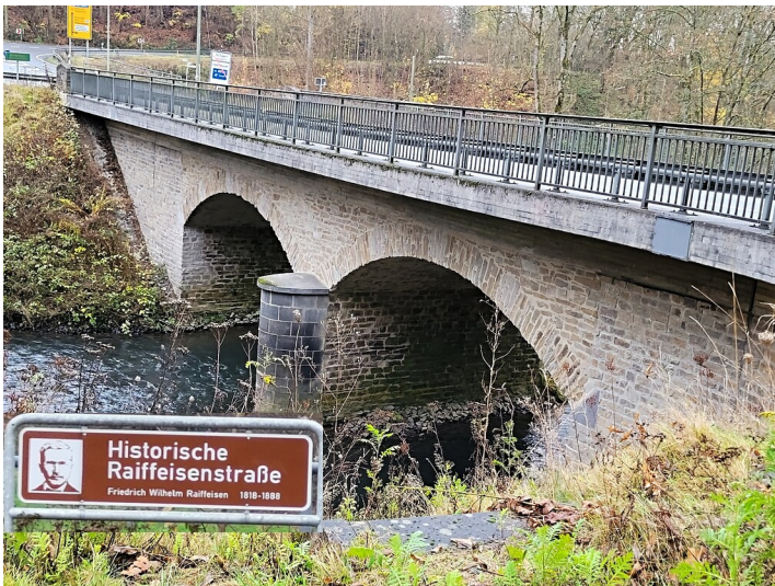
Die Brücke über die Wied zwischen den beiden Ortsgemeinden Eichen und Bürdenbach-Bruchermühle (2021)