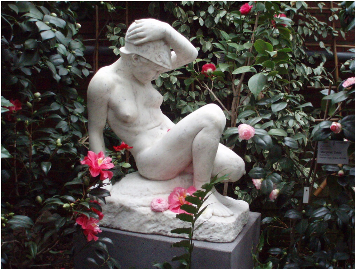
Figur "Sterbende Amazone" im Subtropenhaus der Kölner Flora