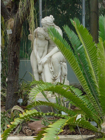
Figurengruppe "Venus und Amor" in der Kölner Flora (2003)