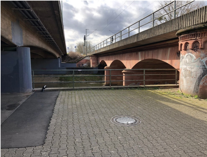
Die Straßenbrücke Kasseler Straße in Bad Vilbel (2020)