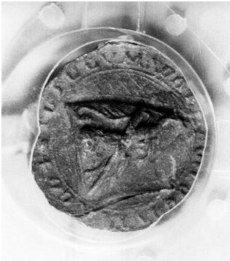
Andreaskreuz am ehemaligen Walhover Hof