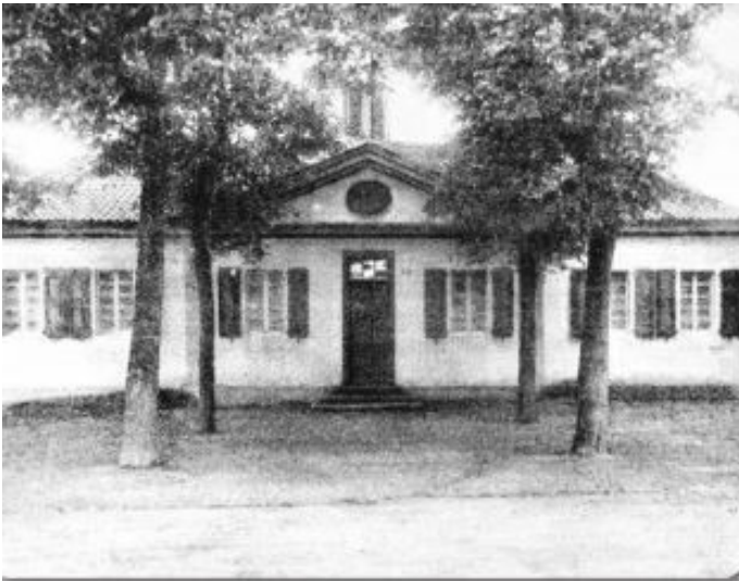
Historische Aufnahme der ehemaligen Schule in Delhoven (Aufnahmedatum unbekannt).