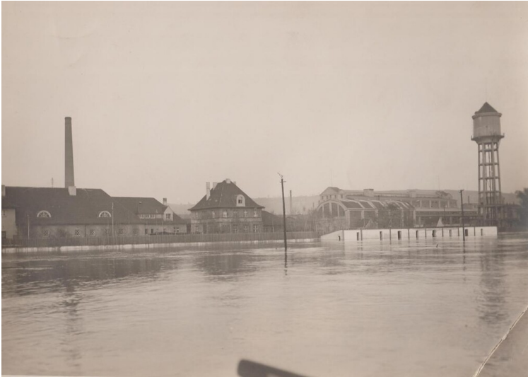
Das Firmengelände der Firma Dr. Otto Bendorf Rheinhafen (1926)