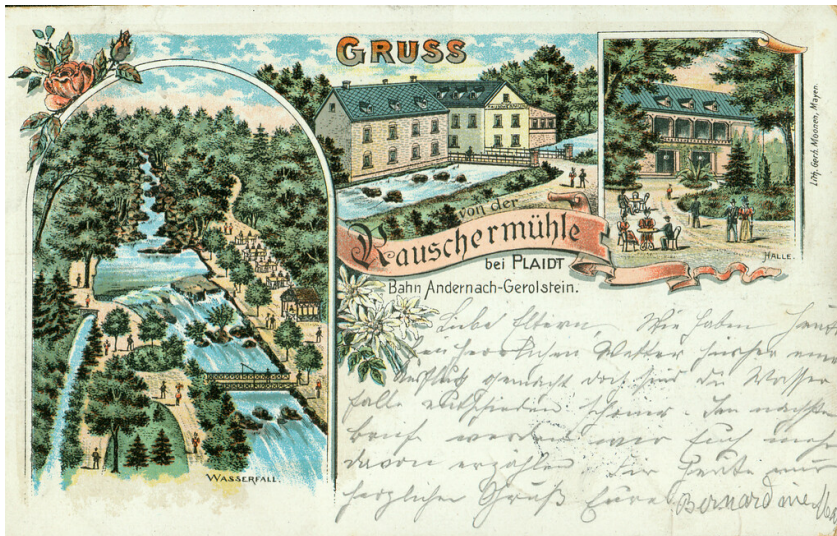
Historische Postkarte mit dem Rauscher Wasserfall und der Rauschermühle an der Nette in Plaidt (gelaufen 1898)