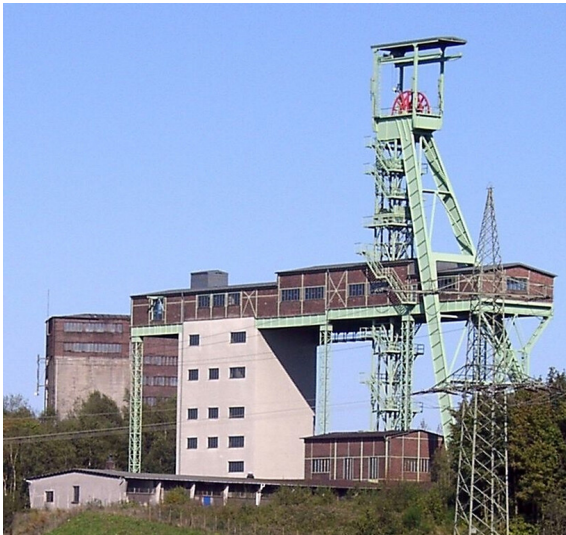
Das Industriedenkmal Grube Georg in Willroth (2021)