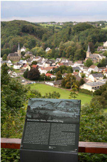
Der Künstlerweg rund um Herchen bietet einen Ausblick auf den Ort (2022)