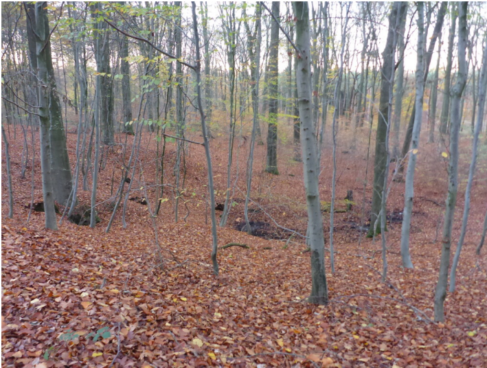
Quellmulde im Reichswald (2020)