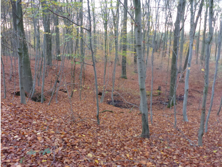
Quellmulde im Reichswald (2020)