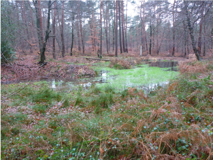
leege Els Sohl (2020)