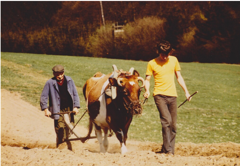
Ackerbau in Kroppach