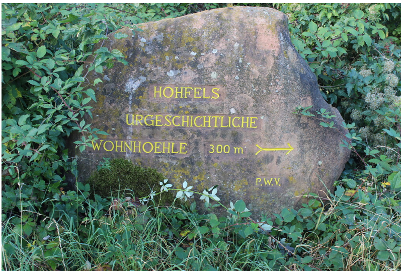
Ritterstein Nr. 293 "Hohfels Urgeschichtliche Wohnhöhle 300 m" nordwestlich von Grünstadt