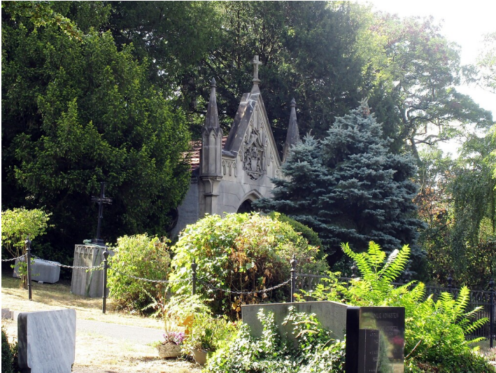
Blick auf die 1857 bis 1859 in Form einer neugotischen Kapelle erbaute Familiengruft der reichsgräflichen Familie Berghe von Trips auf dem Friedhof Kerpen-Horrem (2022).