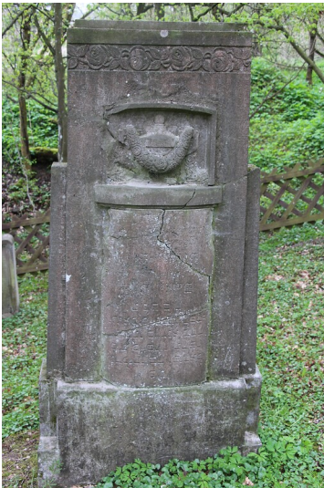
Grabstein auf dem jüdischen Friedhof in Hottenbach (2021)