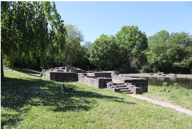
Römische Badeanlage in Übach-Palenberg (2021)