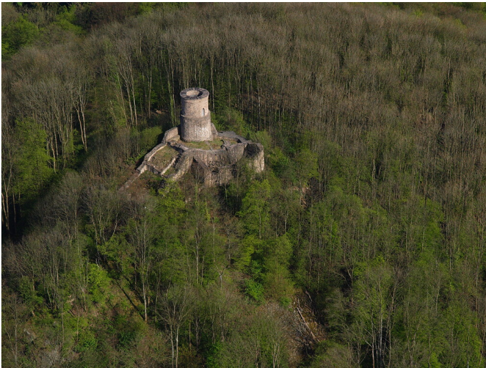
Burgruine Rennenberg bei Linz am Rhein