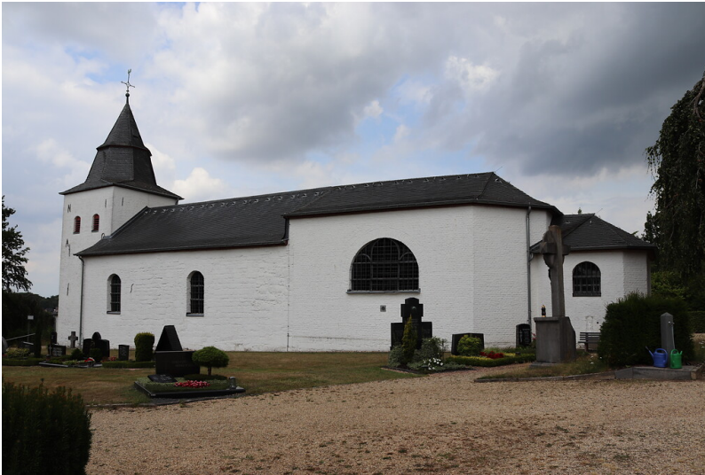
Katholische Kirche St. Dionysius in Frelenberg (2022)