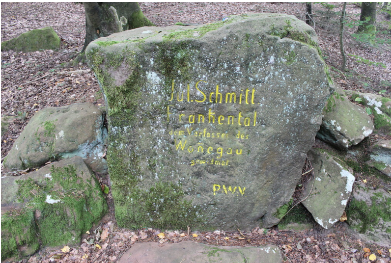
Ritterstein Nr. 284 „Jul. Schmitt. Frankenthal dem Verfasser des Wonegau gewidmet“ südöstlich von Höningen (2021)