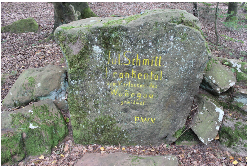
Ritterstein Nr. 284 „Jul. Schmitt. Frankenthal dem Verfasser des Wonegau gewidmet“ südöstlich von Höningen (2021)