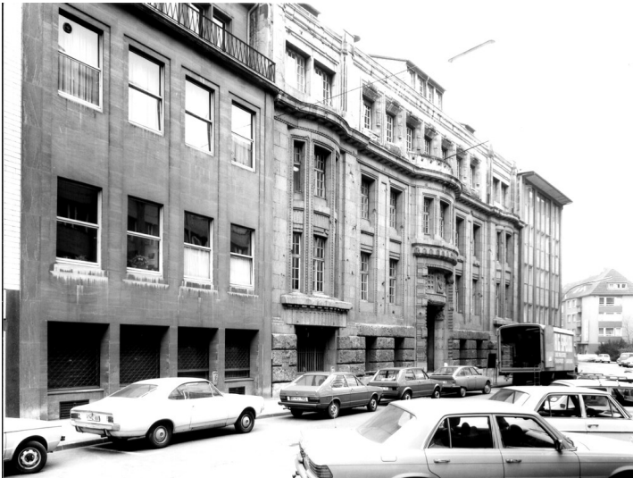
Kreishaus Landkreis Köln (um 1972)