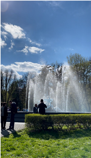
Ivasyk-Telesyk Fountain in Stryiskyi Park in Lviv