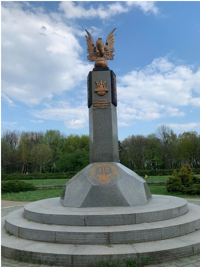
Football monument in Stryiskyi Park in Lviv