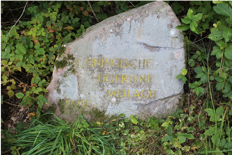
Ritterstein Nr. 281 "Leiningische Hofruine Weilach" westlich von Ungstein (2021)