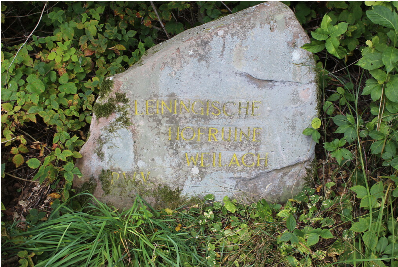
Ritterstein Nr. 281 "Leiningische Hofruine Weilach" westlich von Ungstein (2021)